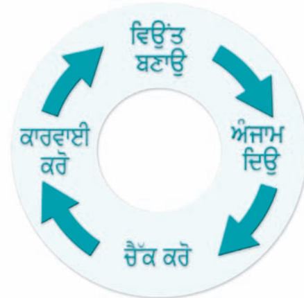
ਡੇਸਿੰਗ, ਡਬਲਿਊ. ਐਡਵਰਡਜ਼। Out of the Crisis . ਐਮ.ਆਈ.ਟੀ. ਪ੍ਰੈੱਸ, 1986, ਅਤੇ ਸ਼ਿਊਹਾਰਟ, ਵਾਲਟਰ ਏ. Statistical Method from the Viewpoint of Quality Control (1939), 1 ਦਸੰਬਰ 1986 ਨੂੰ ਡੋਬਰ ਪਬਲਿਕੇਸ਼ਨਜ਼ ਵੱਲੋਂ ਮੁੜ ਜਾਰੀ ਕੀਤੀ ਗਈ।

ਜਵਾਬਦੇਹੀ ਵਧਾਉਂਦੇ ਅਤੇ ਮਿਆਰ ਸੁਧਾਰਦੇ ਹਨ। ਓਨਟੇਰੀਓ ਦੀ ਸਿਹਤ ਦੇਖ-ਰੇਖ ਪ੍ਰਣਾਲੀ ਵਿੱਚ ਸਾਡੇ ਵੱਲੋਂ ਵੇਖੀਆਂ ਗਈਆਂ ਇਹ ਕੁੱਝ ਕੁ ਹੀ ਗੱਲਾਂ ਹਨ। ਇਹ ਅਜਿਹੀ ਇੱਕ ਮੁਕੰਮਲ, ਸਮੁੱਚੀ, ਕਾਰਗਰ, ਬਰਾਬਰੀ ਵਾਲੀ, ਧਨ ਦੇ ਲੋੜੀਂਦੇ ਨਿਵੇਸ਼ ਵਾਲੀ ਪ੍ਰਣਾਲੀ ਨਹੀਂ ਹੈ ਜੋ ਲੋਕ ਵੇਖਣਾ ਚਾਹੁੰਦੇ ਹਨ। ਪਰ ਜੇ ਓਨਟੇਰੀਓ ਦਾ ਹਰ ਨਾਗਰਿਕ ਦਿਲਚਸਪੀ ਲਵੇ ਅਤੇ ਸੁਧਾਰ ਤੇ ਜ਼ੋਰ ਦੇਵੇ, ਤਾਂ ਜਿਸ ਸਿਹਤ ਦੇਖ-ਰੇਖ ਲਈ ਅਸੀਂ ਪੈਸੇ ਦਿੰਦੇ ਹਾਂ ਅਤੇ ਸਾਂਝਾ ਰੱਖਦੇ ਹਾਂ, ਉਹ ਸਾਨੂੰ ਲੋੜ ਪੈਣ ਤੇ ਮੌਜੂਦ ਹੋਵੇਗਾ, ਅਤੇ ਹੋਵੇਗਾ ਵੀ ਆਹਲਾ ਦਰਜੇ ਦਾ।